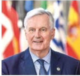
Michel Barnier ist seit 2016 Beauftragter der EU-Kommission für die Austrittsverhandlungen mit dem Vereinigten Königreich

„Wir werden die Arbeit fortsetzen, wobei wir im Blick behalten, dass alle Punkte Bestandteil desselben Abkommens sind und deshalb zusammen beschlossen werden sollten. Ich möchte noch hinzufügen, dass Rechtssicherheit zu allen Punkten, einschließlich der Übergangsphase, die Bestandteil dieses Abkommens ist, erst mit der Ratifizierung des Austrittsabkommens auf beiden Seiten zustande kommt. Nichts ist vereinbart, bis nicht alles vereinbart ist.“