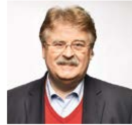
MdEP Elmar Brok (DE, EVP) ist ein deutscher Politiker und Mitglied des Europäischen Parlaments und des Brexit-Lenkungsausschusses

„Das Ausscheiden des Vereinigten Königreichs (VK) aus der EU im März 2019 bringt sowohl für die EU als auch für das VK große, vor allem ökonomische Herausforderungen mit sich. Selbstverständlich ist es für die EU einfacher, den Verlust zu verkraften, stehen doch weiterhin 27 EU-Staaten zusammen, als für das VK, das in Zukunft auch für die EU zum Drittland wird und somit automatisch aus allen EU-Vorteilen und dem Binnenmarkt herausfällt. Gewinner wird es durch den Brexit keine geben, jedoch wird das VK durchaus härter getroffen als die EU. Wir können nur versuchen, den Schaden so gering wie möglich zu halten.“