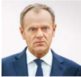
Donald Tusk Präsident des Europäischen Rates

„Wir werden die Arbeit fortsetzen, wobei wir im Blick behalten, dass alle Punkte Bestandteil desselben Abkommens sind und deshalb zusammen beschlossen werden sollten. Ich möchte noch hinzufügen, dass Rechtssicherheit zu allen Punkten, einschließlich der Übergangsphase, die Bestandteil dieses Abkommens ist, erst mit der Ratifizierung des Austrittsabkommens auf beiden Seiten zustande kommt. Nichts ist vereinbart, bis nicht alles vereinbart ist.“